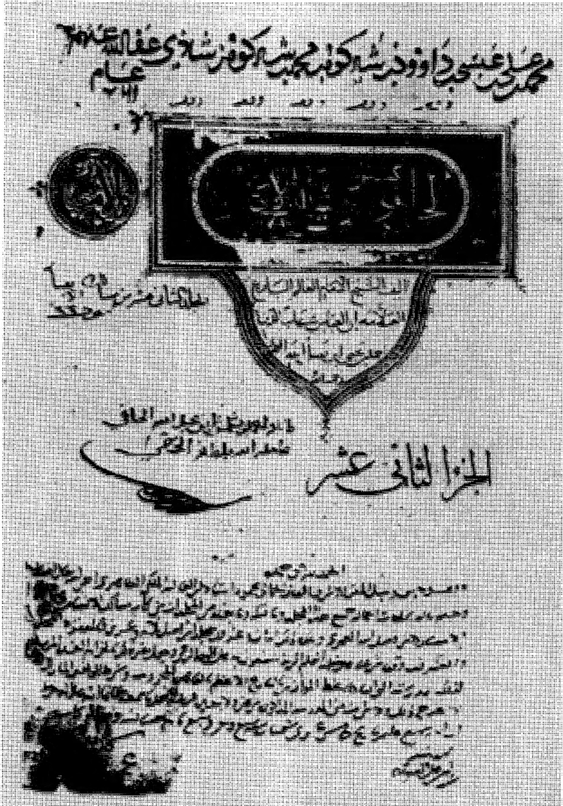
صفحة العنوان - مخطوطة أيا صوفيا - المكتبة السليمانية - استانبول رقم ٣٤٢٥